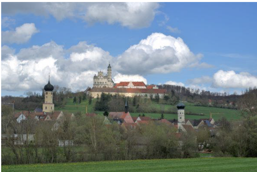
Wechselhaftes Aprilwetter erzeugte eindrucksvolle Lichtspiele über der Altstadt von Neresheim. Spaziergänger und Wanderer nutzen die Regenspausen.

Beim Blick auf die statistischen Klimadaten der zurückliegenden 30 Jahre zeigte sich der März mit 5,4 Grad Celsius Mitteltemperatur insgesamt mild. Die Niederschlagsmenge von 73,7 Liter pro