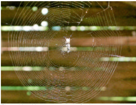
Einmal ins Netz gegangen - für immer verloren.