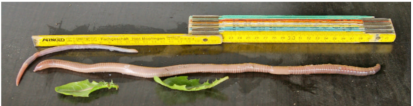
Riesenregenwurm ( Lumbricus polyphemus)

Im April hatte es viel und oft geregnet. Die oberen Bodenschichten waren gut durchfeuchtet. Eine Wandergruppe ließ sich vom Regen nicht aufhalten. Auf einer gut ausgebauten Waldstraße auf der Östlichen Alb lagen immer wieder Regenwürmer. Einer unterschied sich durch seine auffallende Größe deutlich von den übrigen (Foto). Eine Biologin der Wandergruppe erinnerte sich, daß es einen besonders großen Regenwurm gäbe, den Badischen Riesenregenwurm, der jedoch nur in einem begrenzten Gebiet in Südbaden vorkommen würde.