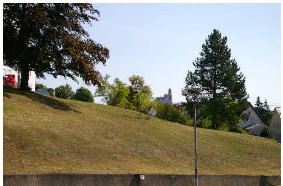
In Privatgärten möchten Gemeinderäte Insekten schützen und greifen mit Verboten in die Privatsphäre der Bürger ein. Die Grünflächen der Gemeinde, die ihrer Obhut unterliegen, werden sehr oft im Jahr gemäht, die aufkommenden Blüten werden zerstört und die Insektenlarven vernichtet, die an diesen Wildkräutern leben, darunter viele Schmetterlingsraupen. Die Devise soll heißen: „Wachsen lassen, nicht die Bürger entmündigen!“

Nach dem kalendarischen Sommeranfang steigerte sich der Sommer unter Hoch „Ulla“ zur vorläufigen Höchstform in dieser Jahreszeit. Beinahe eine Woche