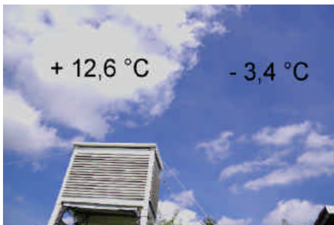
IR-Temperaturmessung am 15. September 2019 um 12.05 Uhr MEZ, Temperatur in zwei Meter Höhe: 23,6 °C, in fünf Zentimeter über Grund: 30,2 °C