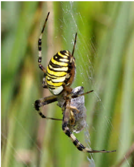
Im August zeigte sich die Wespenspinne (Argiope bruennichi) nach vielen Jahren der Abwesenheit am Teich bei der Wetterwarte. Hier mit einer Feldwespe, die sie blitzschnell mit einer Wolke aus Spinnfäden eingewickelt hatte.

lang war es weitgehend wolkenlos. Bei ungehindertem Sonnenschein dehnte sich das Quecksilber im Thermometer an fünf Tagen bis nahe an die 35-Grad-Markierung aus. In den sternklaren Nächten kühlte es gegen Monatsende wohltuend aus. Die Luftbewegung war in diesem Witterungsabschnitt sehr gering. Ein kühlendes Lüftchen wurde von vielen herbeigesehnt. Ein knitzer Härtsfelder stellte beim Anblick der still stehenden Windräder schmunzelnd fest: Da könne ja kein Wind wehen, wenn die alle abgeschaltet sind.