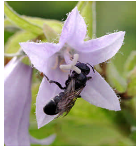
Während eines Gewitters mit leichtem Regen hatte sich diese Wildbiene am Blütengrund der Glockenblume aufgehalten.

Im Anschluss daran prägten Tiefdruckgebiete und ihre Regenwolken das Wettergeschehen. Bei den hohen Temperaturgegensätzen in der Atmosphäre bildeten sich Gewitter, aus denen bis zum Monatsende immer wieder starke Regenschauer niedergingen, wobei das Innere Härtsfeld am Ort der Wetterwarte eher am Rand der Regengebiete lag und sich deshalb auch nur wenig in den Messgefäßen sammelte. Die Wärmegrade zeigten nur wenig über 20 Grad Celsius an. Der Monatsletzte war ein Regentag, der die Regenbilanz mit über 20 Prozent Anteil zwar nicht ausgleichen, aber immerhin positiv beeinflussen konnte.