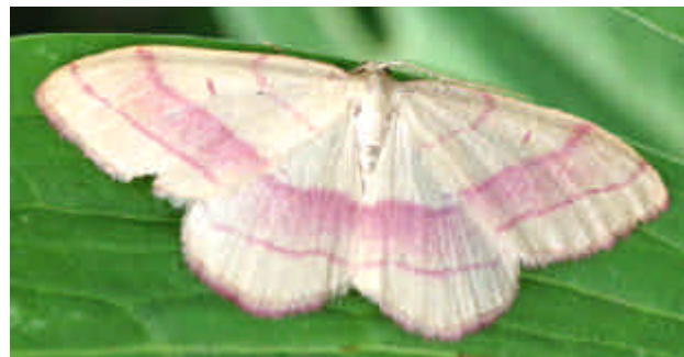
Der Rotbandspanner ( Rhodostrophia vibicaria ) ist in mehreren Klimaregionen verbreitet. Seine Raupe lebt bevorzugt an unterschiedlichen Schmetterlingsblütlern.