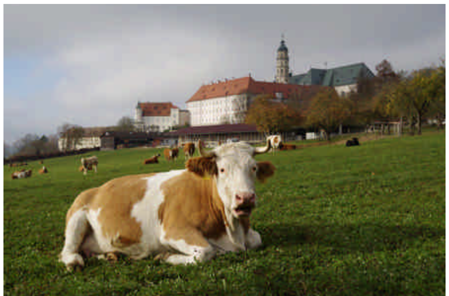
Das Klostergut Neresheim hält 30 Mutterkühe. Die meiste Zeit des Jahres sind die Rinder auf der Weide bei der Abtei Neresheim. Die Kühe und ihre Kälber genießen noch den Sonnenschein in der zweiten Novemberhälfte.

Der starke Luftdruckanstieg ließ bis zum Monatsende kaum noch Wolkenbildung zu. Viel Sonnenschein am Tage erwärmte die Luft noch bis über 20 Grad Celsius. Nachts kühlte es wegen der fehlenden Wolkendecke stark aus, mit der Folge von Luft- und Bodenfrost. Frostempfindliche Pflanzen zeigten dies auch ohne Thermometer an.