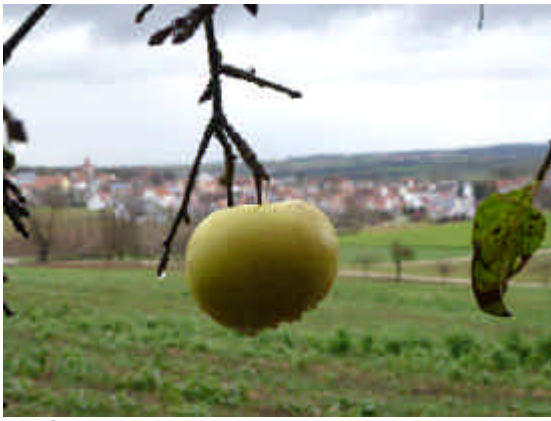
Im Spätherbst bei Maihingen im Nördlinger Ries mit Blick auf Uzwingen.

Zu Beginn der dritten Dekade verharrte das Quecksilber im Thermometer bei Dauernebel dauerhaft unter der Null-Grad-Markierung. In der Klimastatistik wird der 21. des Monats deshalb als Eis-tag geführt. Auf dem Härtsfeld sind Eistage im November nicht ungewöhnlich. In den nachfolgenden Tagen bewegten sich die gemittelten Temperaturwerte meist um den Gefrierpunkt.