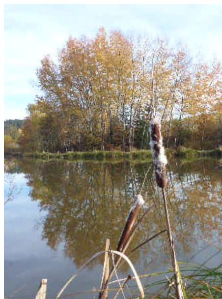
Novemberstimmung am Eisenweiher im Bühlertal.

Der hohe Luftdruck über Osteuropa verstärkte sich zu Beginn des mittleren