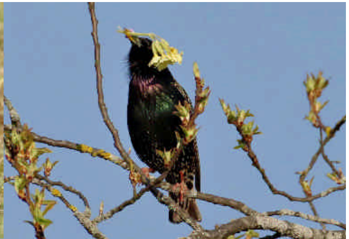
Vogelhochzeit: „Ein Vogel wollte Hochzeit halten ...“ Der Star pflückte auf der Wiese eine Schlüsselblume und warb auf einer Traubenkirsche mit hellem Gesang und variierenden Strophen um die Gunst der Partnerin - mit Erfolg.

Zehn-Grad-Marke. Gegen Monatsende vervollständigte erneuter Schneefall, eine geschlossene Schneedecke und gefrorener Erdboden das in der Meteorologie bekannte Bild vom „Märzwinter“.