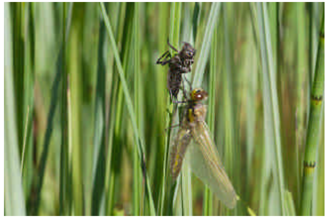
Bildtext und Fotos: Guido Wekemann

In den Morgenstunden stieg die Libellenlarve an den Seggen aus dem Wasser, die Gestaltumwandlung begann. Die nun entwickelte Libelle durchbrach die Larvenhaut kopfüber, richtete sich mit einer raschen Bewegung auf und zog den Hinterleib vollständig aus der Hülle. Nun wurden die Körperteile und Flügel mit Körperflüssigkeit gefüllt und erreichten so ihre endgültige Ausdehnung. Die Flügel müssen noch trocknen und erhalten dann ihre Festigkeit. Noch bevor die Libelle flugfähig war wurde sie von einer Feldwespe attackiert. Sie ließ sich ins Wasser fallen, wo ihr sehr kurzes Leben unter Einwirkung anderer Wasserbewohner (Bergmolch) endete.