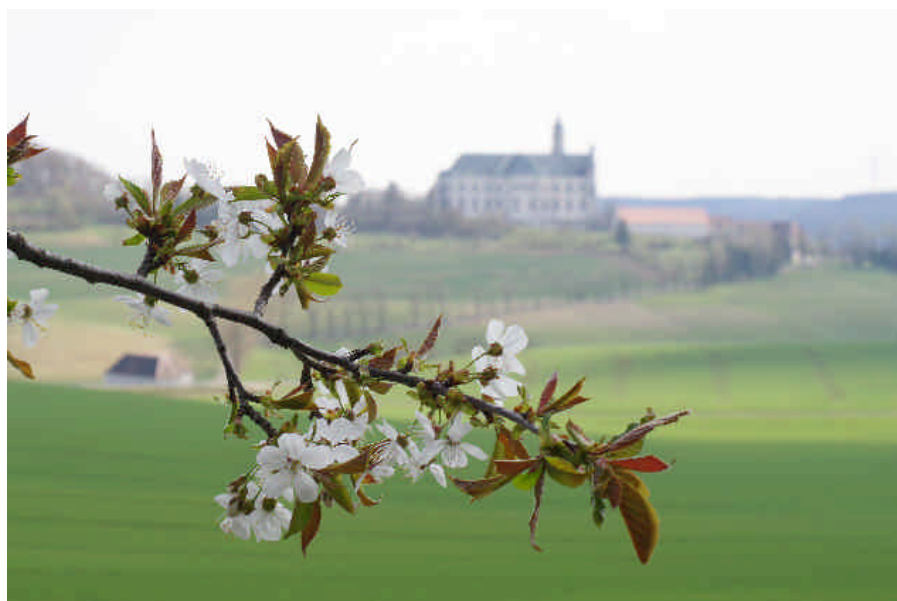
Kirschblüte im April ließ eine gute Ernte erwarten, sofern Spätfröste ausblieben.

Nur an zwei Tagen der dritten Dekade reichten die Tageshöchstwerte über die