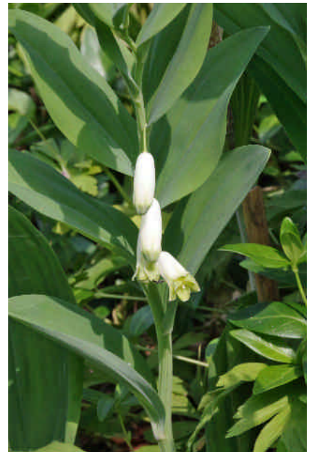
Salomonsiegel ( Polygonatum odoratum ) mit kantigem Stengel unterscheidet sich eindeutig von Vielblütiger Weißwurz ( Polygonatum multiflorum ), runder Stengel.

Gottesdienste, das gemeinsame Beten, waren nicht erlaubt; die gestattete Gottesdienstpraxis wurde von den Regierenden angeordnet. Pfarrer und