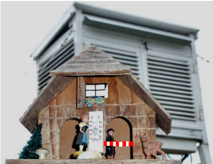
Der Wettermann hat Ausgehverbot - witterungsbedingt!