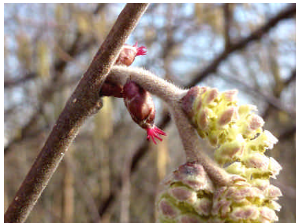
Die Blüte der Hasel zeigt den Beginn des Vorfrühlings an. Das Foto entstand Anfang Februar im Nördlinger Ries. Auf dem Härtsfeld stäubte die Hasel eine Woche später.

Fünf Tage lang hielt die spätwinterliche, sonnige Wetterlage an. Zu Beginn des mittleren Monatsdrittels prägte das sehr ausgedehnte Tief „Sabine“ das Wettergeschehen. Schneeregen, Graupelschauer, zwei Gewitter und Windböen bis Windstärke neun über einen Zeitraum von mehr als 24 Stunden war das Ungewöhnliche an diesem Wintersturm.