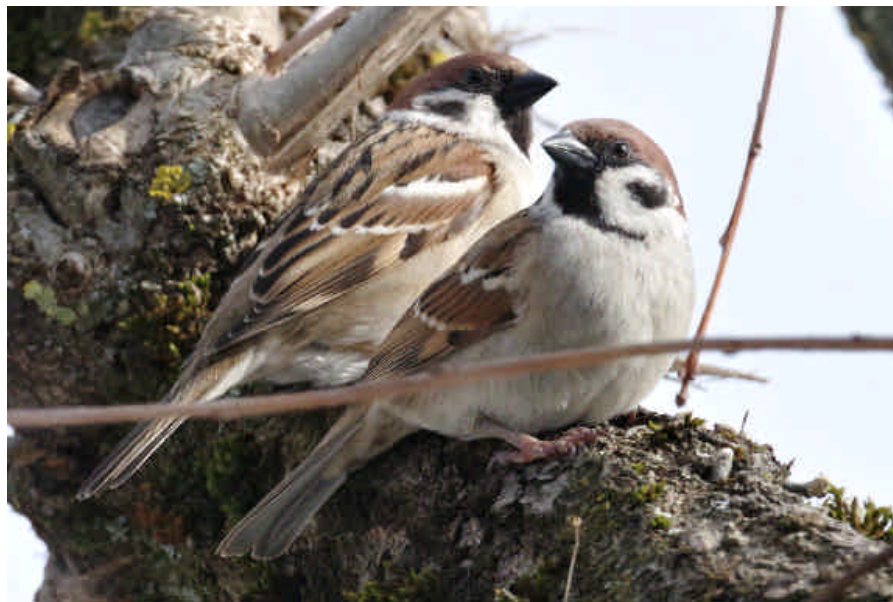
Die Feldsperlinge wärmen sich in der Frühlingssonne..

Unter Föhneinwirkung wurde am Monatsletzten die höchste Tagestemperatur mit 13,2 Grad Celsius gemessen; sie lag um sechs Zehntel Grad unter dem Höchstwert vom 5. Januar 1999