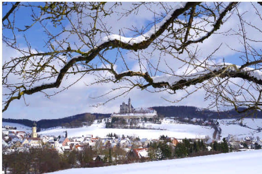
Gegen Ende des dritten Wintermonats war das Härtsfeld vier Tage lang mit Schnee bedeckt.

Nach den Feiertagen bestimmte das ausgedehnte und beständige Hoch „Wiltrud“ vier Tage lang bis zum Jahresende das Wetter. Die Eintragungen der umfassenden Wetterbeobachtung zeigen die tiefsten Kältegrade, fast ungehinderter Sonnenschein am Tage und dauerhaft, bis 12 Zentimeter Tiefe, gefrorener Boden.