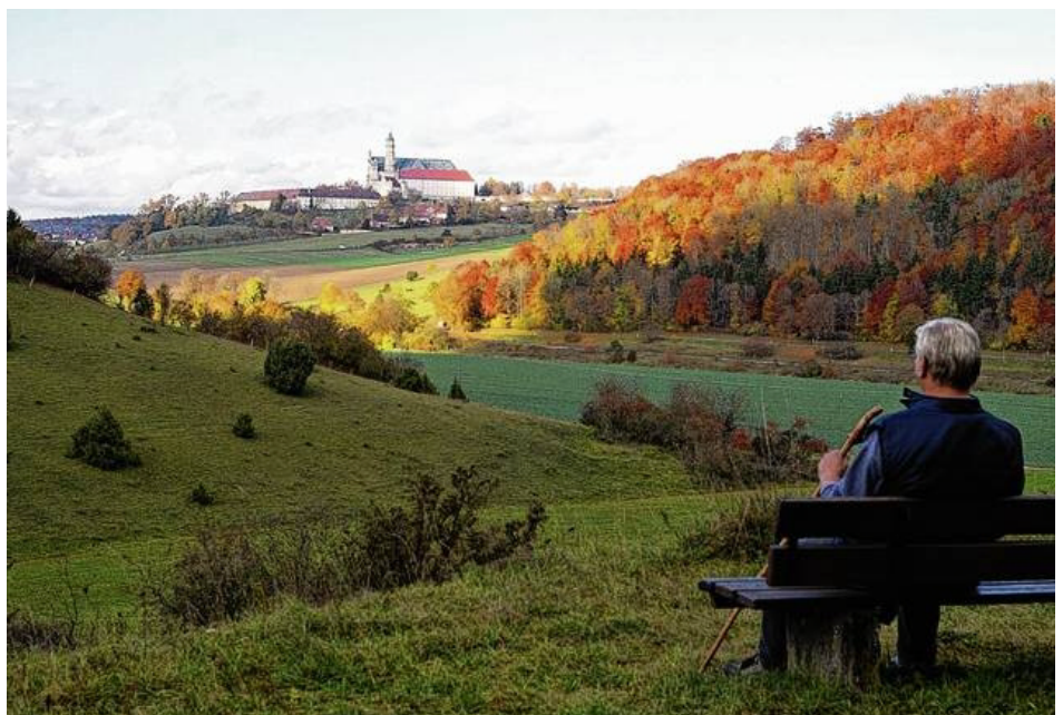
Licht, Luft und die schnell vergängliche Farbenvielfalt des Herbstes in Ruhe auf sich wirken lassen, oder: Die Seele streicheln mit goldenem Oktober.

Der September war ob des unterschiedlichen Witterungsverlaufs ziemlich ausgeglichen temperiert und wick 12,7 Grad Celsius nur wenig vom langjährigen Ver-