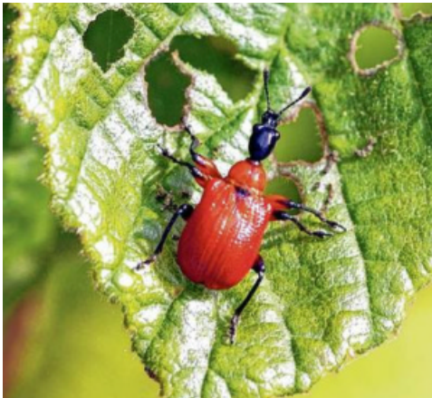
Der Haselblattroller (Aporoderus coryli) .

gleichswert zu mehr Wärme hin ab. Die Sonne lag mit 150 Stunden meteorologisch definiertem Sonnenschein um mehr als 11 Prozent unter dem mittleren Wert.