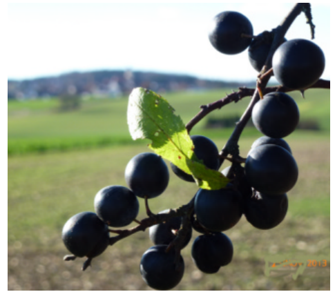
Steinfrüchte des Schwarzdorns (Schlehe) eignen sich für allerlei Köstlichkeiten.

Der Referent kritisierte den Handel mit CO 2 -Zertifikaten wie er derzeit praktiziert werde und entwarf das Modell „Klimaneutralität“, das bei nicht wenigen Zuhörern Verwunderung und Kopfschütteln auslöste: Jeder einzelne könne durch geeigneten Ausgleich seine Lebensführung so gestalten, dass diese „klimaneutral“ sei.